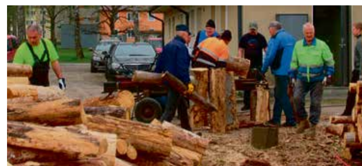
Talgupäev Kadrinas.

Kihlevere talgutel lõi kaasa ligi 30 suurt ja väikest talgu-