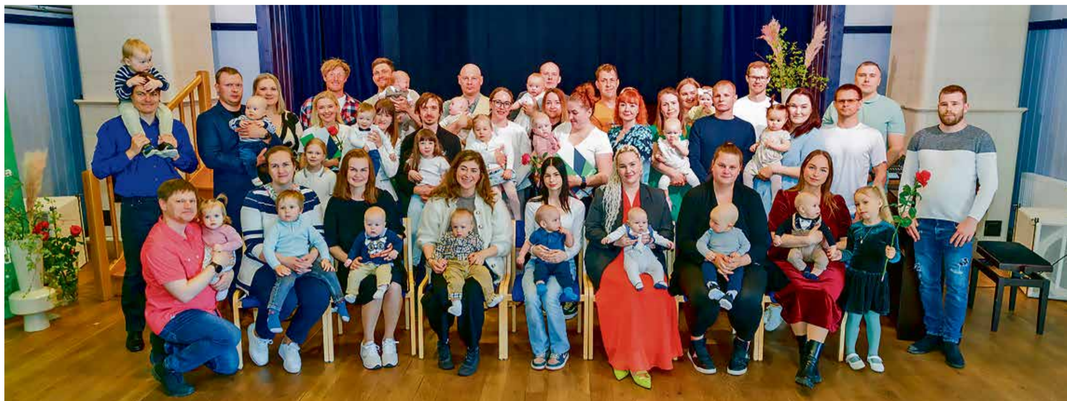
Hõbesõle vastuvõtul osalenud uued vallakodanikud oma vanematega.