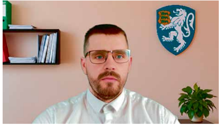
Pilt kelmist, kes esitleb end WhatsApp video-kõnedes politsei-ametnikuna.