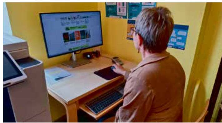
Kadrina raamatukogu uus lugejaarvuti.

Raamatukogu õpetab ja abistab erinevate arvutitoimingute juures, sealhulgas internetipangas maksete tegemisel, dokumentide digiallkirjastamisel ning terviseportaali kasutamisel. Eriti on oodatud vanemaegelised, kes soovivad oma digioskusi arendada.