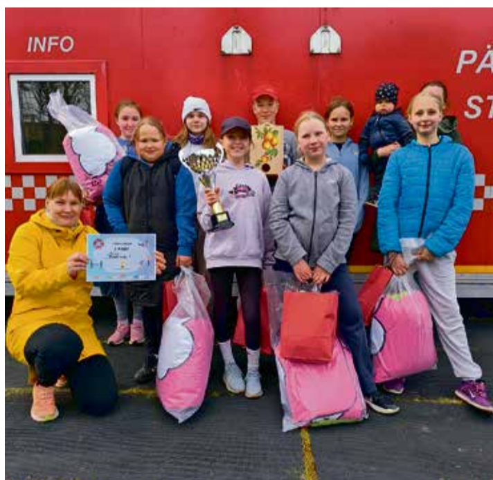
Kadrina päästeringi võistlejad.