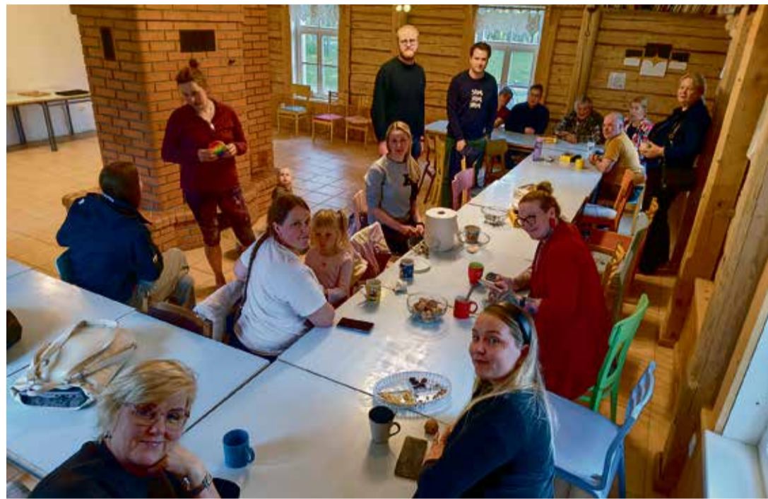
Külade ümarlaud Ridakülas.