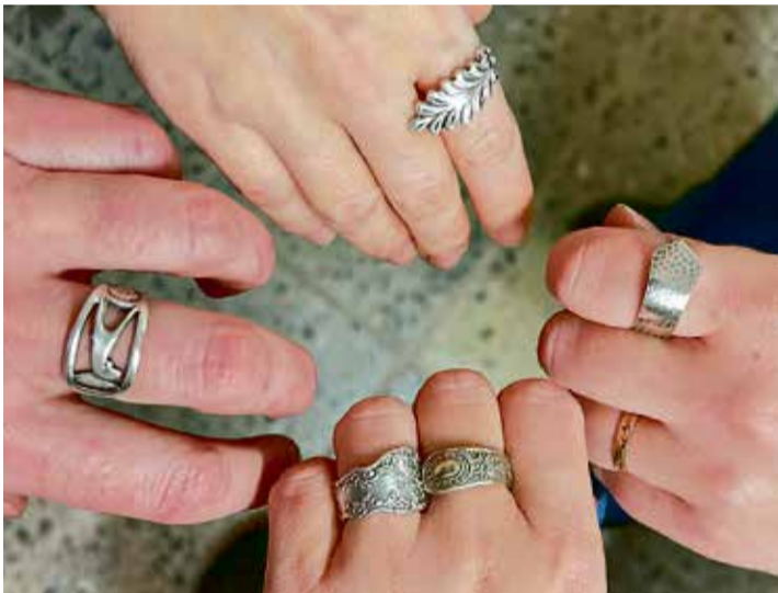
Töötoas valminud ehted.