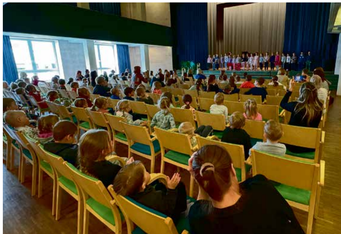
Saalitäis väikesed muusikasõpru.

Kadrina Kunstidekool võõrustas 19. mail Kadrina Huvikeskuses ligi 150 muusikahuvilist last Kadrina lasteaiast Sipsik.