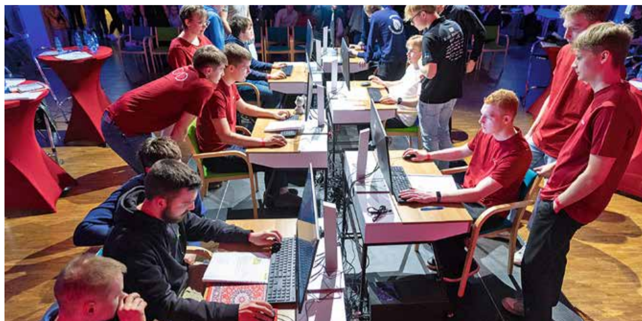
Võistlejad võistlustules.