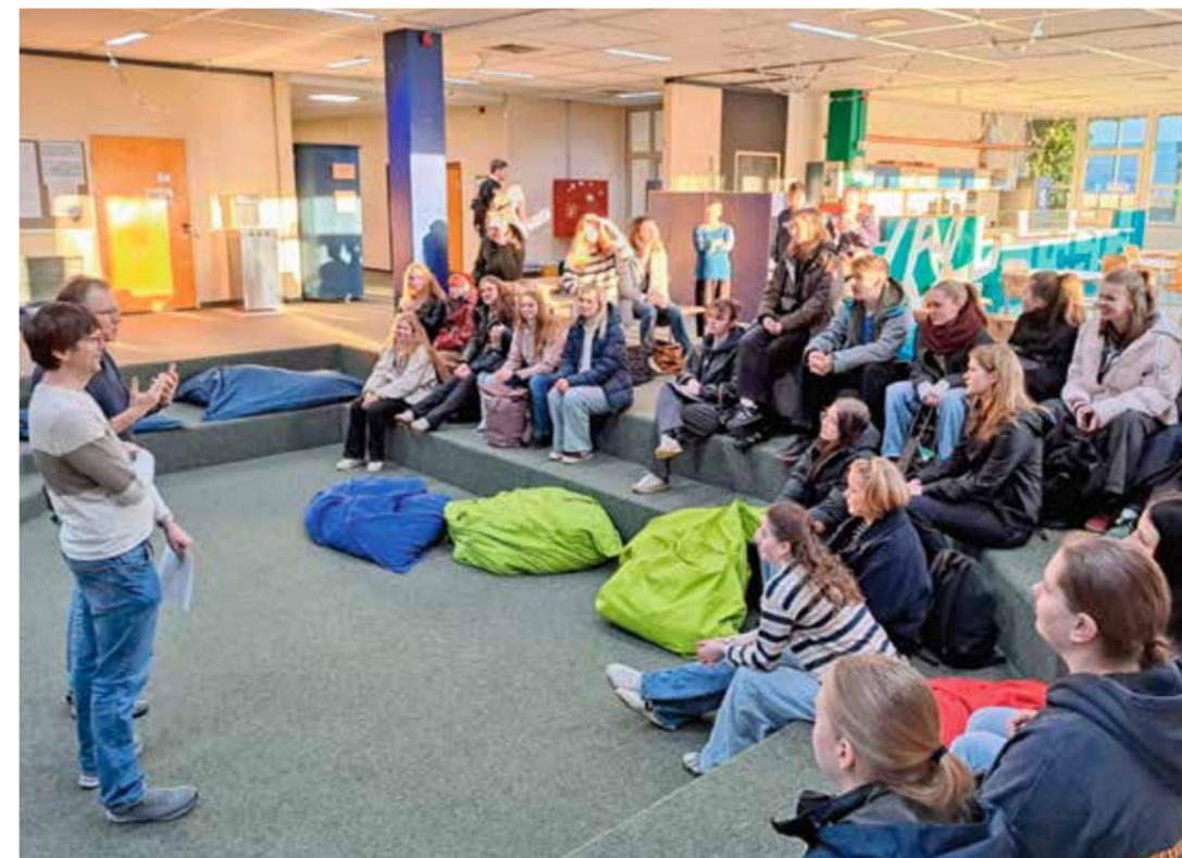
Avasõnad ja tervitused kooli vanema astme puhkealal.

Väljasõitudel külastati Lübecki ja Kieli, käidi Laboe mereväe memoriaalis ning valmistati küünilaid Krumbbecki küünlavabrikus. Need ko-