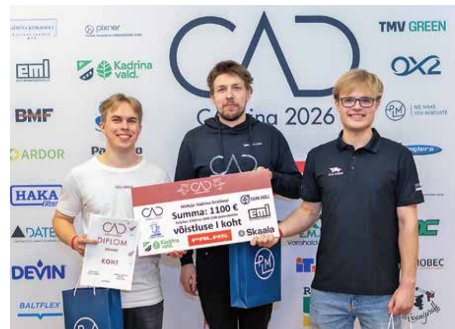
CADrina 2026 arvutijoonestusvõistluse võitnud tiim Solaride.