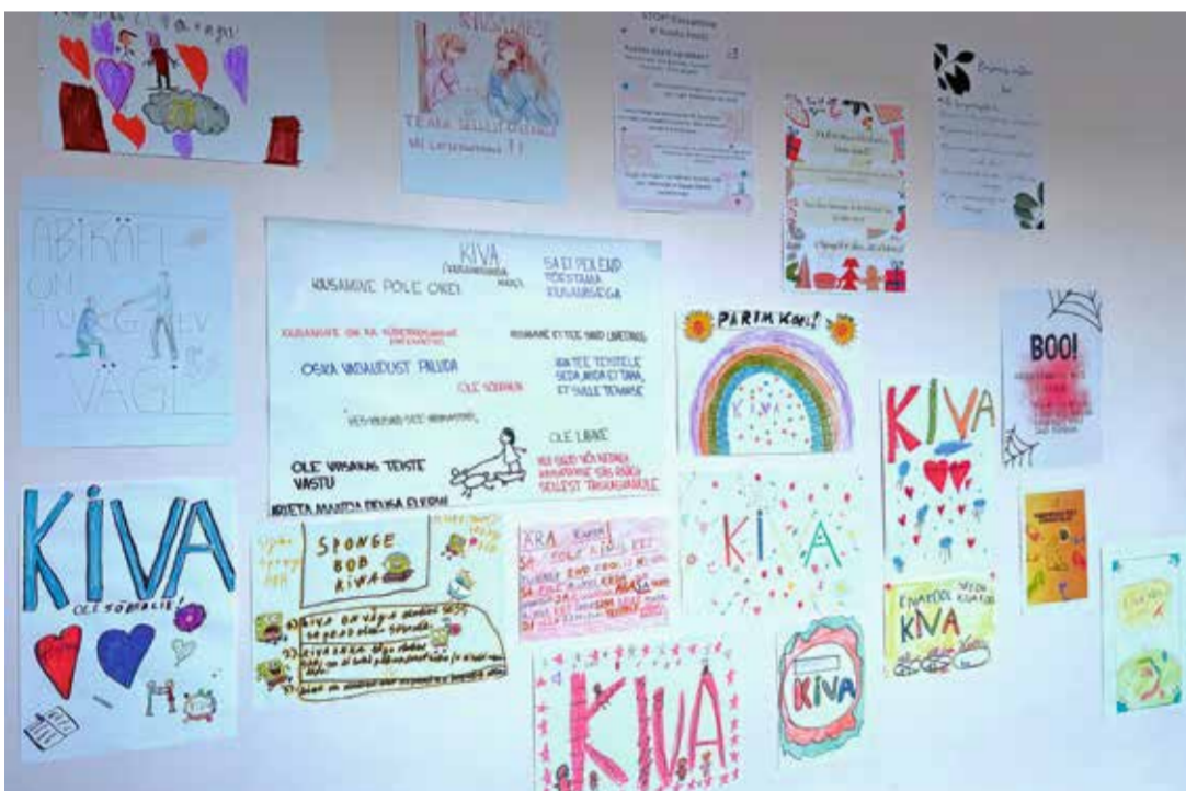
Kadriina Keskkoolis toimunud 2024/25. õa jõuonituskonkursi „Seinad kõnelevad ehk KiVa plakatid igasse klassi“ raames loiid õpilased plakateid, mis edastavad kiusamisvastast sõnumit.

Kadriina Keskool on alates 2022/2023. õppeaastast liitunud KiVa ehk kiusamisvaba kooli programmiga. See on koolidele suunatud teadus- ja tõendus põhine lähenemine, mille eesmärk on kujundada turvaline ja hooliv õpikeskkond.